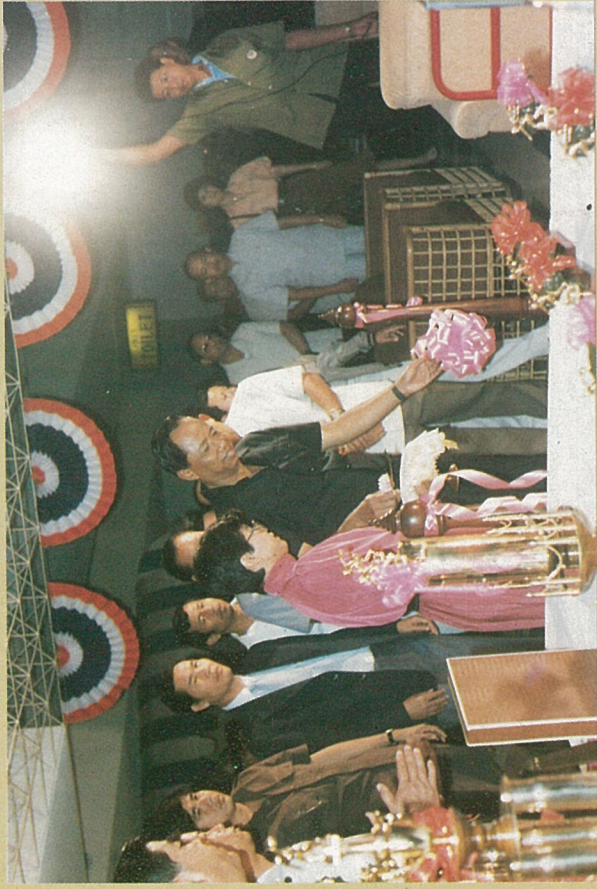
๑๘ กุมภาพันธ์ ๒๕๒๗ พลเอกอาทิตย์ กำลังเอก เป็นประธานการแข่งขันโบริลิ่งการกุศล หาทุนสมทบสร้างตึกทำนุผู้หญิงประภาศรี กำลังเอก ศูนย์บริการทางการแพทย์ มศว บางแค ณ พัทย์โบว์ จากนั้นเดินทางมาเยี่ยมชมการก่อสร้าง