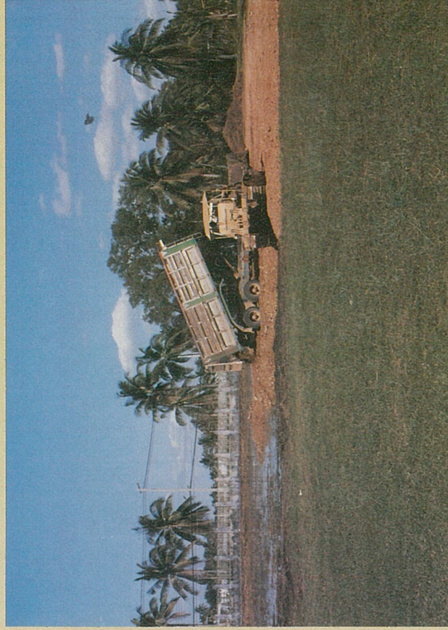
ทหารช่าง ช.พัน ๑๑๑ เริ่มปรับพื้นที่ก่อสร้างอาคารเมื่อ ๓๐ ธันวาคม ๒๕๒๖