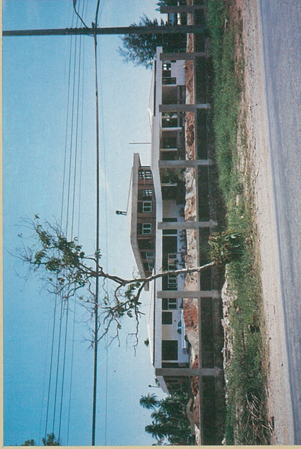
ความก้าวหน้าในการก่อสร้างอาคาร เมื่อวันที่ ๕ และ ๒๑ พฤษภาคม ๒๕๒๗