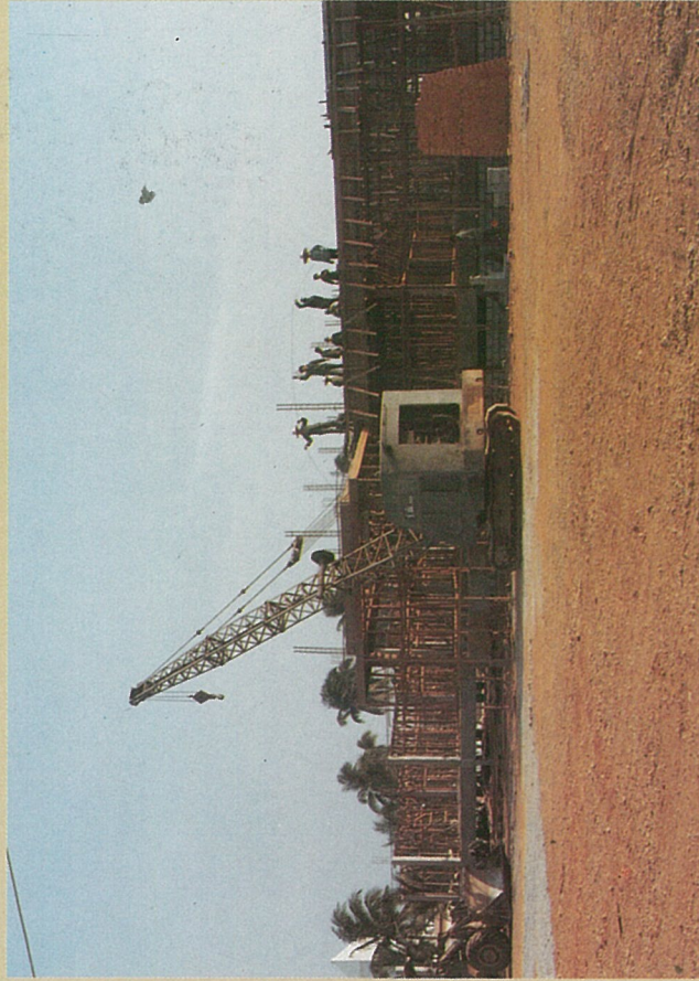
๑๘ กุมภาพันธ์ ๒๕๒๗ เริ่มมองเห็นโครงสร้างเป็นรูปอาคาร