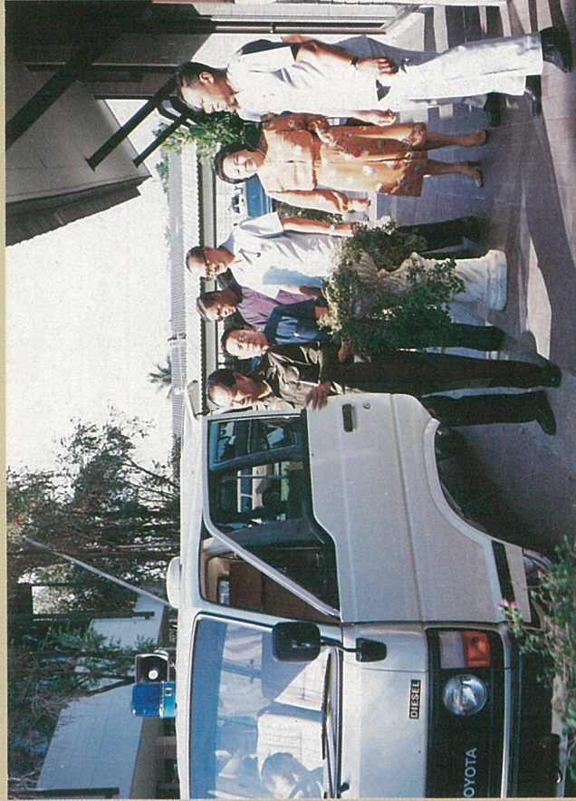
๕ เมษายน ๒๕๒๗ พลเอกอาทิตย์ กำลังเอก มอบรถพยาบาลซึ่งมีอุปกรณ์พร้อมเพื่อนำไป บริการของศูนย์บริการทางการแพทย์ ๑ คัน